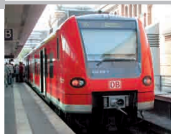
Umfangreich gefördert: S-Bahn-System Hannover

Für das Weser-Ems-Gebiet: Fahrzeuge der LNVG